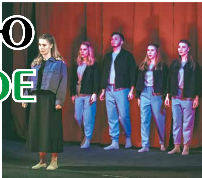
Театральная студия «Обмен», спектакль «Навсегда?»

За окном весна, хочется веселиться и даже танцевать. Чувствуется прилив энергии! Но становится грустно, когда понимаешь, что на улице светит яркое солнышко, а ты занят подготовкой к занятиям и больше ничем. Знакомо? Редакция «Статус-ВО» расскажет подробнее о том, куда можно деть энергию, которая так хочет вырваться наружу.