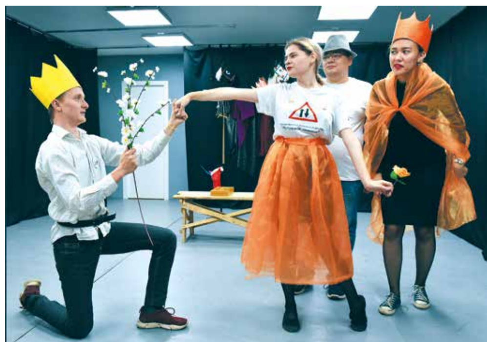
Театр-студия «Встреча», спектакль «Чинизано»